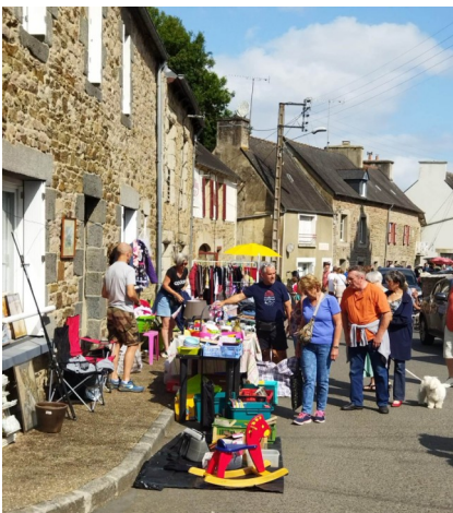
Brocante le 6 août