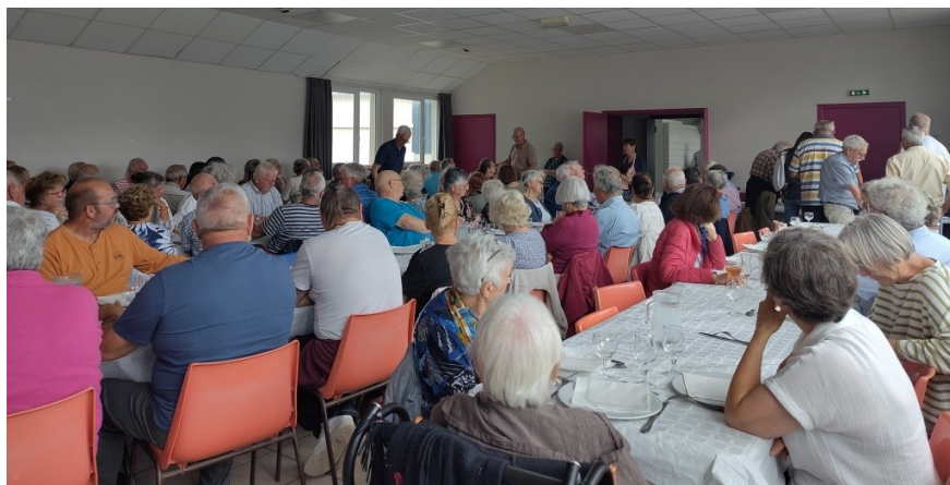
Le « repas-couscous » 2025