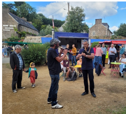
Le 14 juillet au bourg