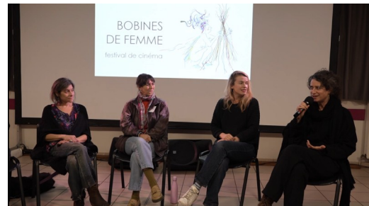
Festival cinéma 13, 14, 15 et 16 novembre