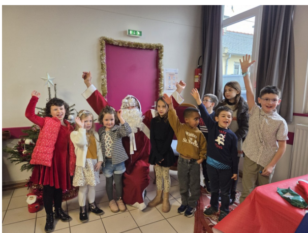
Noël à Lanloup le 20 décembre