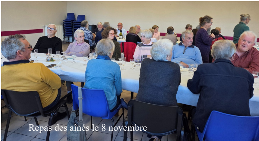
Repas des aînés le 8 novembre