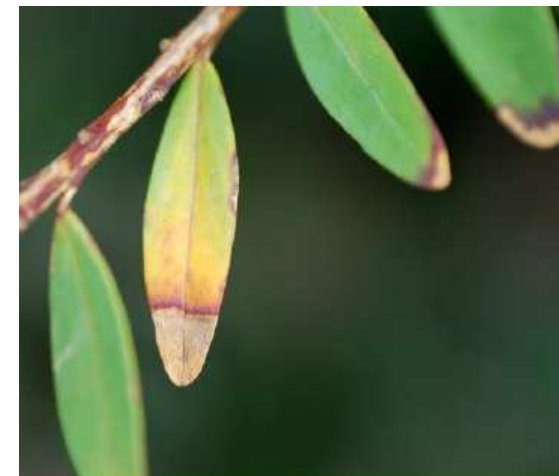
Brunissement à Xylella fastidiosa sur Polygala myrtifolia