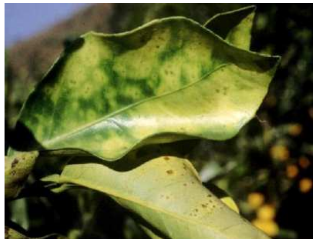
taches chlorotiques typiques de Xylella fastidiosa sur Citrus sinensis

Le non-aoûtement au niveau des nœuds est un symptôme spécifique qui doit fortement alerter.