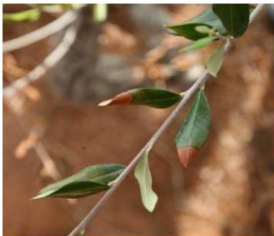
Brunissement foliaire à Xylella fastidiosa sur Olea europaea