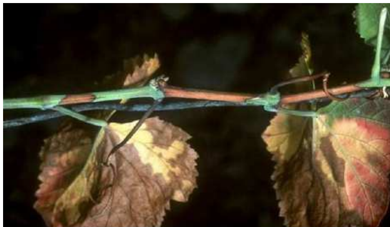
Xylella fastidiosa sur Vitis vinifera

Le non-aoûtement au niveau des nœuds est un symptôme spécifique qui doit fortement alerter.