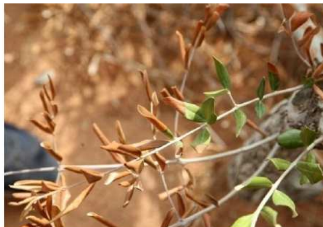
et finalement Dépérissement