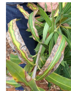
Nerium oleander (Laurier rose)

En cas de suspicion, contacter immédiatement le SRAL Bretagne pour une inspection officielle. Assurez vous au préalable que la plante a été correctement arrosée (sans excès) et qu'elle fait partie des végétaux sensibles à Xylella fastidiosa .