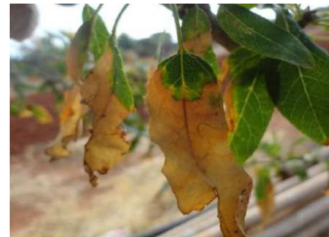
Brunissement foliaire à Xylella fastidiosa sur Prunus amygdalus